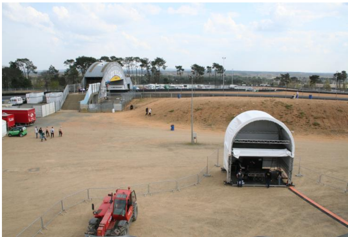
Régie 6,00m x 4,00m – 1 étage + couverture ( option )