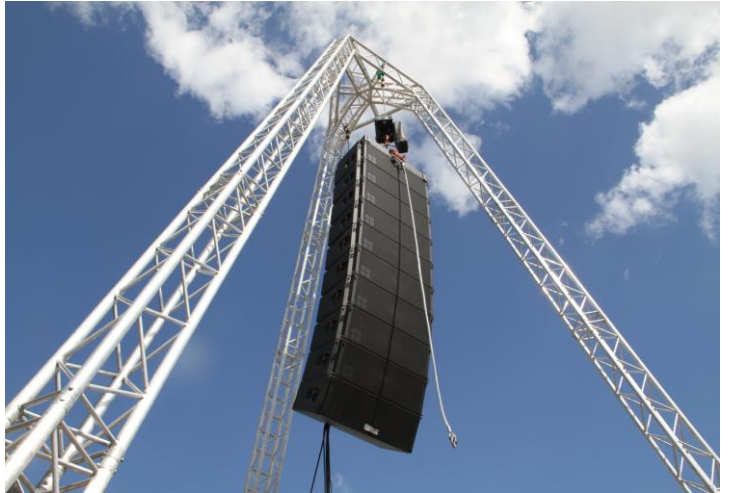
Tripod – Charge 2,5 Tonne maximale ( option )