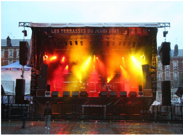
Alpha 80 – version simple