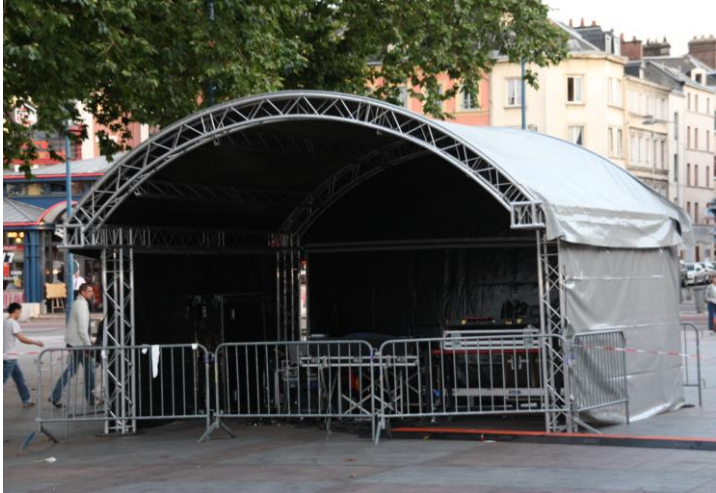
Régie couverte 6,00m x 6,00m ( option )