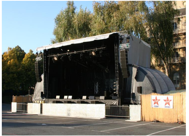
Alpha 80 avec extensions ( option )