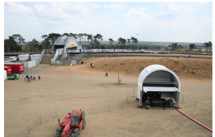
Régie 6,00m x 4,00m – 1 étage + couverture ( option )