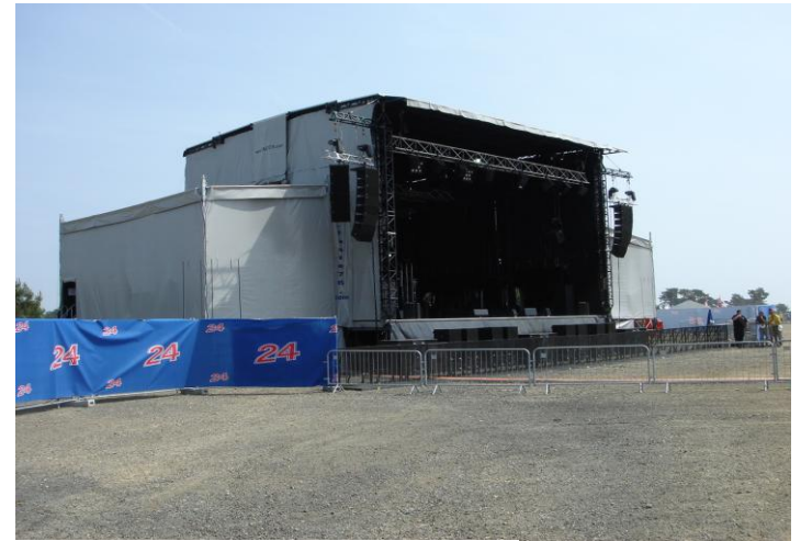
Alpha 160 avec extensions 70 m 2 ( option )