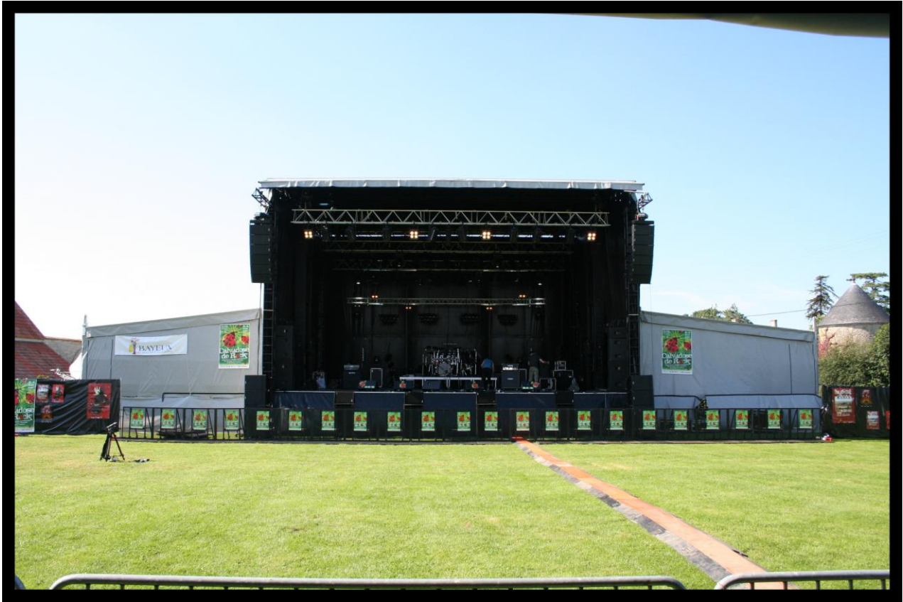
Alpha 160 kit festival complet : 304m 2 couvert avec extensions 72,00m 2