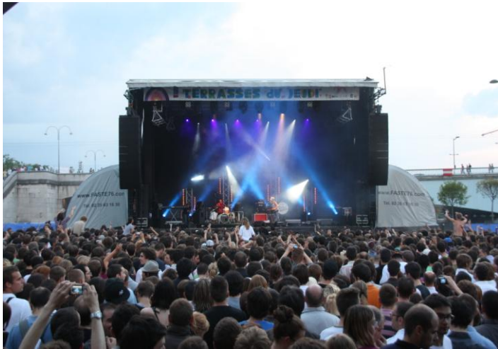
Alpha 160 – avec extensions 36m 2 ( option )