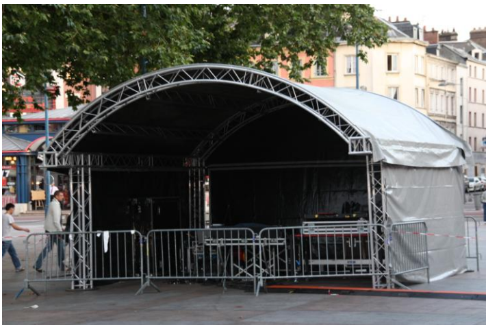
Régie couverte 6,00m x 6,00m ( option )